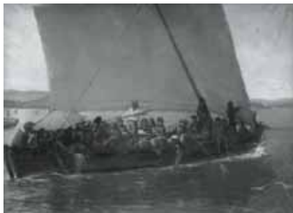
nº 1274 – Barca llena de gente en una bahía (abocetado) Óleo sobre lienzo 119 x 160 cm.