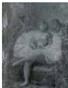
nº 1242 – Bailarina sentada Óleo sobre lienzo 40 x 32 cm.