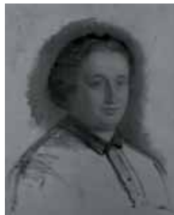
nº 1275 – Retrato femenino (cabeza) Óleo sobre lienzo 52 x 42 cm.