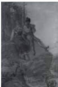
nº 1266 – Pastorcillos (abocetado) Óleo sobre lienzo 100 x 66 cm.