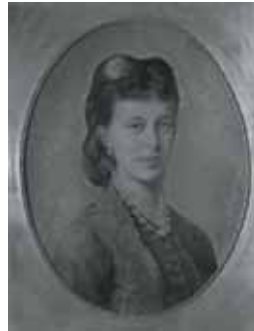
nº 1247 – Retrato femenino Óleo sobre lienzo 58 x 45 cm.