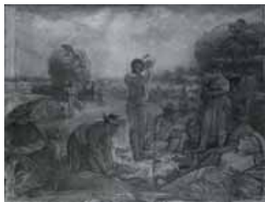
nº 1277 – Campesinos en la siega (abocetado) Óleo sobre lienzo 74 x 99 cm.