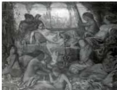
nº 1236 – Odaliscas Óleo sobre lienzo 36 x 47 cm.