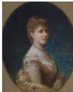
nº 1259 – Retrato de la Reina María Cristina de Habsburgo Óleo sobre lienzo 37 x 29 cm.