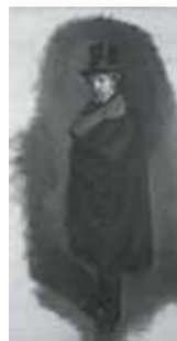
nº 1253 – Retrato de caballero con chistera y capa (abocetado) Óleo sobre lienzo 54 x 35 cm.