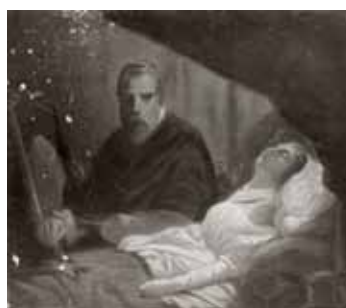
nº 1234 – Mujer moribunda con un pintor al lado Óleo sobre cartón 16 x 21cm.