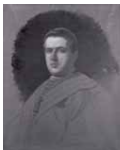
nº 1231 – Prelado Óleo sobre lienzo 74 x 59 cm.