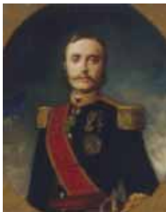
nº 1258 1870 Retrato de S. M. el Rey Alfonso XII de medio cuerpo Óleo sobre lienzo 37 x 29 cm.