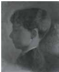
nº 1250 – Cabeza de niño de perfil (inacabada) Óleo sobre lienzo 21 x 16 cm.