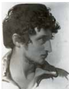
nº 1227 – Cabeza masculina de perfil (inacabada) Óleo sobre lienzo 38 x 30 cm.