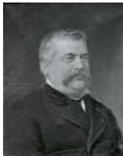
nº 1251 1880 Retrato masculino Óleo sobre lienzo 37 x 29 cm.