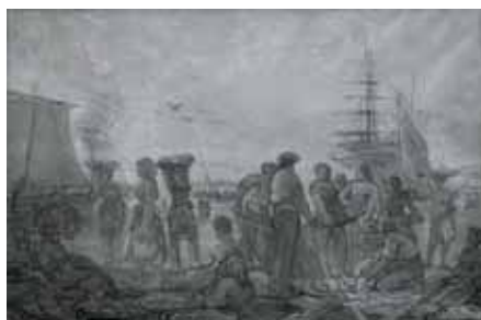
nº 1278 – Pescadores en la playa (abocetado) Óleo sobre lienzo 108 x 163 cm.