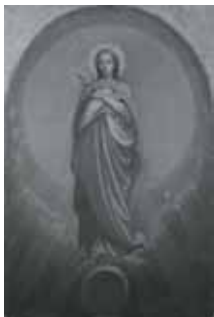
nº 1262 – Inmaculada (medio punto) Óleo sobre lienzo 53 x 35 cm.