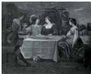
nº 1238 – Banquete o La disipación del hijo pródigo Óleo sobre lienzo 27 x 33 cm.