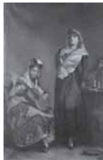
nº 1263 – Cantaora con guitarrista femenina Óleo sobre lienzo 76 x 50 cm.