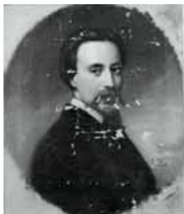
nº 1225 – Retrato masculino de perfil Óleo sobre lienzo 58 x 49 cm.

Obras de Leopoldo Sánchez del Bierzo conservadas en la Real Academia de Bellas Artes de San Fernando (53).