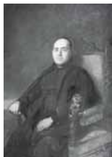
nº 1230 – Retrato de clérigo sentado Óleo sobre lienzo 142 x 100 cm.