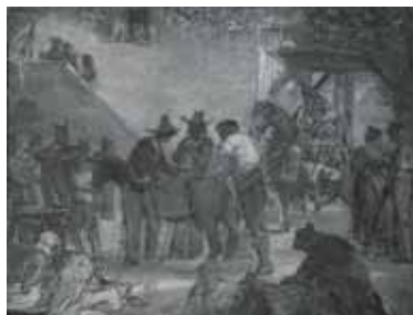
nº 1276 – Hombres ensillando una caballería (abocetado) Óleo sobre lienzo 92 x 120 cm.