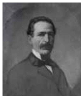
nº 1232 – Retrato masculino Óleo sobre lienzo 59 x 49 cm.