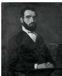
nº 1233 – Retrato masculino de tres cuartos Óleo sobre lienzo 79 x 63 cm.