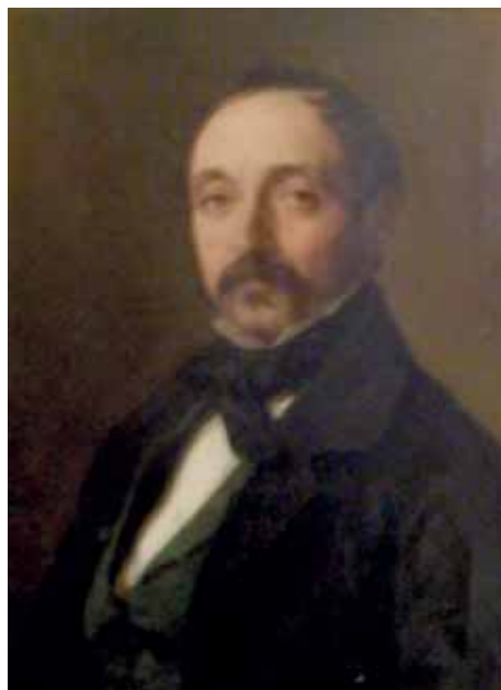
Retrato de hombre. Colección particular.