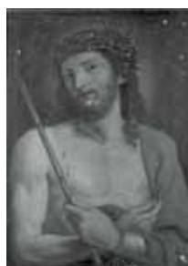
nº 1279 – Ecce Homo Óleo sobre lienzo 55 x 41 cm.