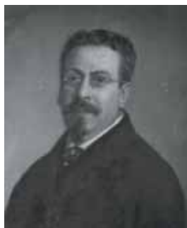
nº 1255 – Busto masculino con gafas y perilla Óleo sobre lienzo 52 x 43 cm.