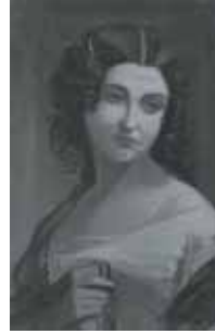
nº 1245 – Retrato femenino Óleo sobre lienzo 55 x 35 cm.