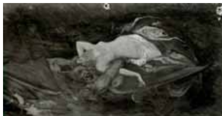
nº 1235 – Desnudo femenino tendido y agarrado por un monstruo Óleo sobre cartón 18 x 36 cm.