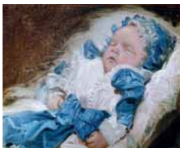
nº 1239 – Retrato yacente del Príncipe de Asturias, Don Luis (copia de F. de Madrazo) Óleo sobre lienzo 33 x 44 cm.