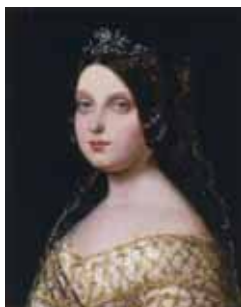
nº 1229 1849 – Retrato de Isabel II (busto, copia de F. de Madrazo) Óleo sobre lienzo 55 x 43 cm.