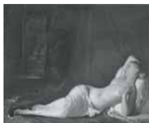
nº 1261 – Desnudo femenino tendido Óleo sobre lienzo 53 x 65 cm.