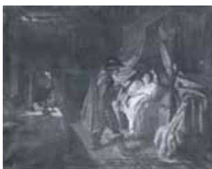
nº 1260 1866 Caballero entrando en el dormitorio de una dama Óleo sobre lienzo 79 x 98 cm.