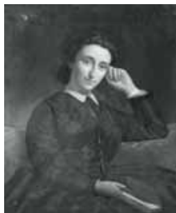
nº 1226 – Retrato femenino de tres cuartos Óleo sobre lienzo 79 x 65 cm.