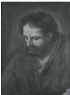
nº 1248 – Apóstol Óleo sobre lienzo 55 x 41 cm.