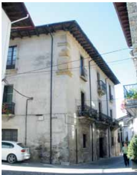
Casa natal del pintor Leopoldo Sanchez Diaz en la Calle del Agua de Villafranca del Bierzo.

Siendo alumno de la Real Academia, participó con dos retratos – Retrato de señora (busto) y Retrato de hombre (busto)– en la primera Exposición Nacional de Bellas Artes, celebrada en 1855 2 . El jurado, del que formaba parte su maestro Federico de Madrazo, le concedió una mención de honor. Sin embargo, no volvería a intervenir en este