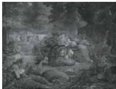
nº 1265 – Parejas bebiendo en un jardín con acompañamiento musical (abocetado) Óleo sobre lienzo 107 x 138 cm.