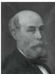
nº 1252 – Cabeza masculina barbada Óleo sobre lienzo 37 x 29 cm.