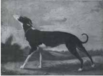
nº 1244 – Galgo cazador Óleo sobre lienzo 37 x 51 cm.