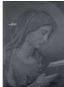
nº 1249 – Virgen leyendo Óleo sobre lienzo 57 x 43 cm.