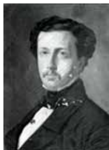
nº 1228 – Retrato de D. Francisco de Asís de Borbón (copia de F. de Madrazo) Óleo sobre lienzo 48 x 37 cm.