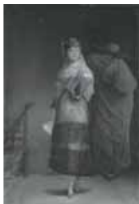
nº 1264 – Maja y embozado Óleo sobre lienzo 76 x 50 cm.