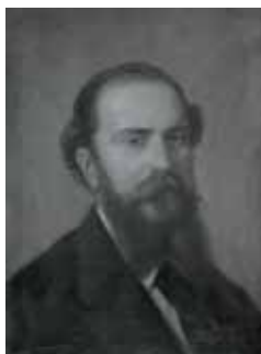
nº 1254 – Retrato de hombre joven barbado Óleo sobre lienzo 55 x 42 cm.