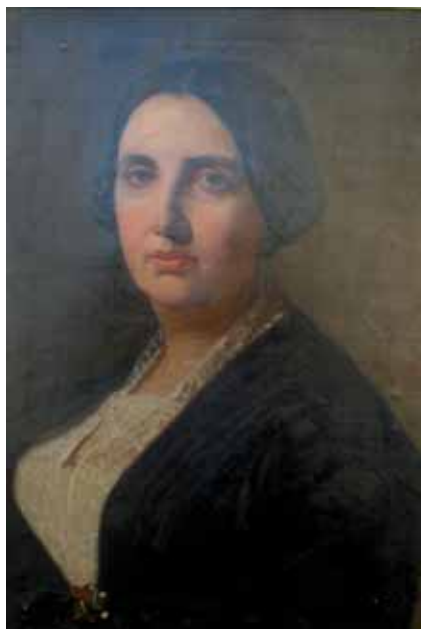
Retrato de mujer. Colección particular.