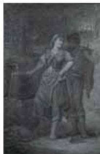
nº 1267 – Pareja de labradores Óleo sobre lienzo 88 x 57 cm.