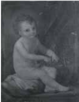
nº 1246 – Niño Jesús sentado, con frutos en las manos Óleo sobre lienzo 73 x 56 cm.