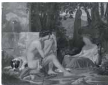
nº 1237 – Escena mitológica (inacabada) Óleo sobre lienzo 26 x 33 cm.