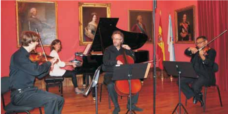
Cuarteto de las Naciones.

lo) y Alicia González Permuy (piano), quienes interpretaron el Cuarteto con piano, en sol menor, K 478 y el Cuarteto con piano, en mi bemol mayor, K 493 , de Wolfgang Amadeus Mozart.