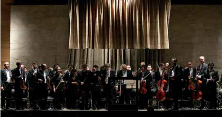
La Orquesta Sinfónica de Galicia. (Foto OSG).