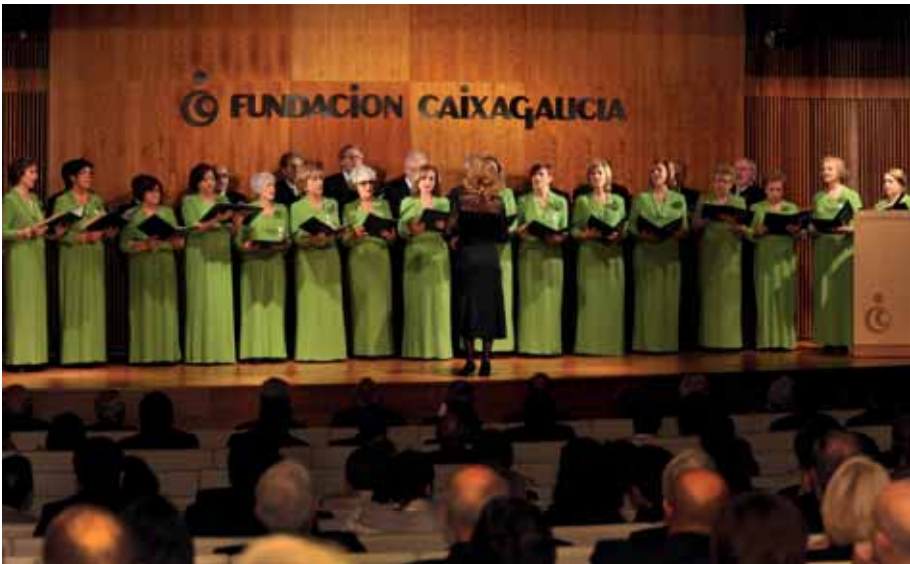
La Coral «Liceo de Ourense». (Foto F. Torrecilla).