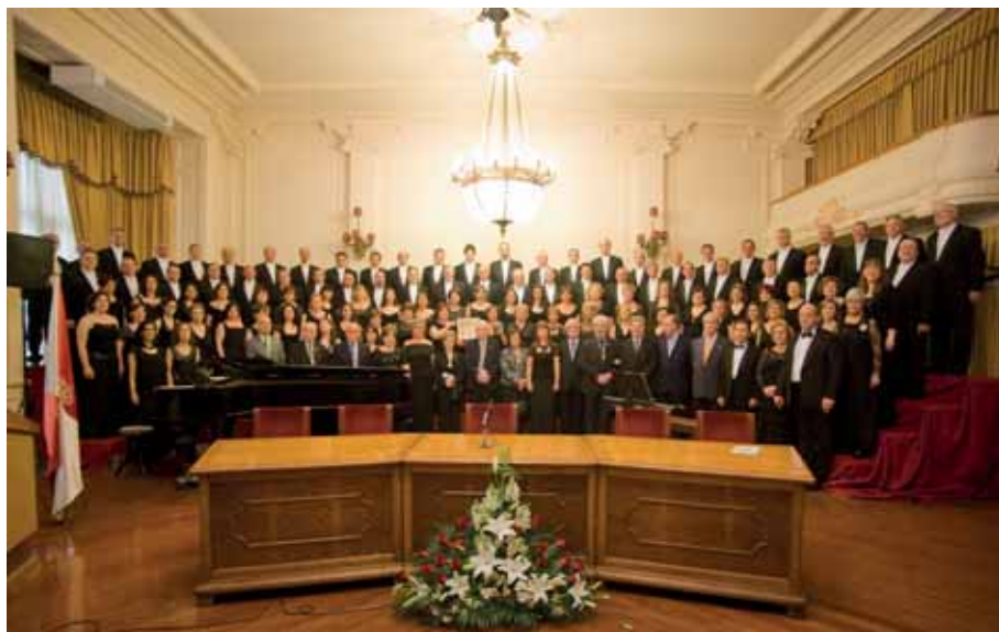
Coral Casablanca. (Foto: Archivo Coral Casablanca).