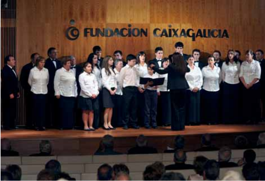
La Agrupación Coral San Miguel de Lores, de Meaño-Pontevedra. (Foto F. Torrecilla).