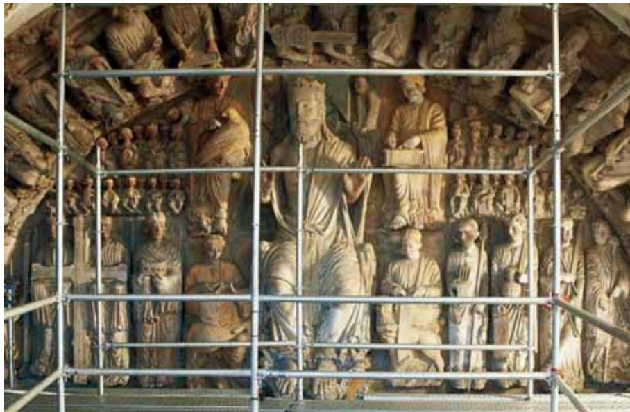
Andamiaje del Pórtico de La Gloria. (Foto: El País.com Jordi Sarrá).

En el mes de marzo se informó de la incorporación en la página Web de la Academia del manifiesto sobre la situación del Pórtico de la Gloria de la Catedral de Santiago de Compostela, según se había acordado en la sesión del 30 de enero de 2010.