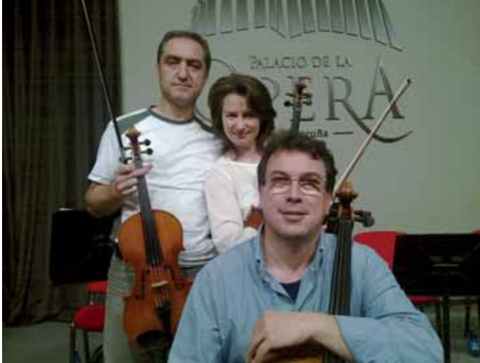
Los componente del Trio Stretto.