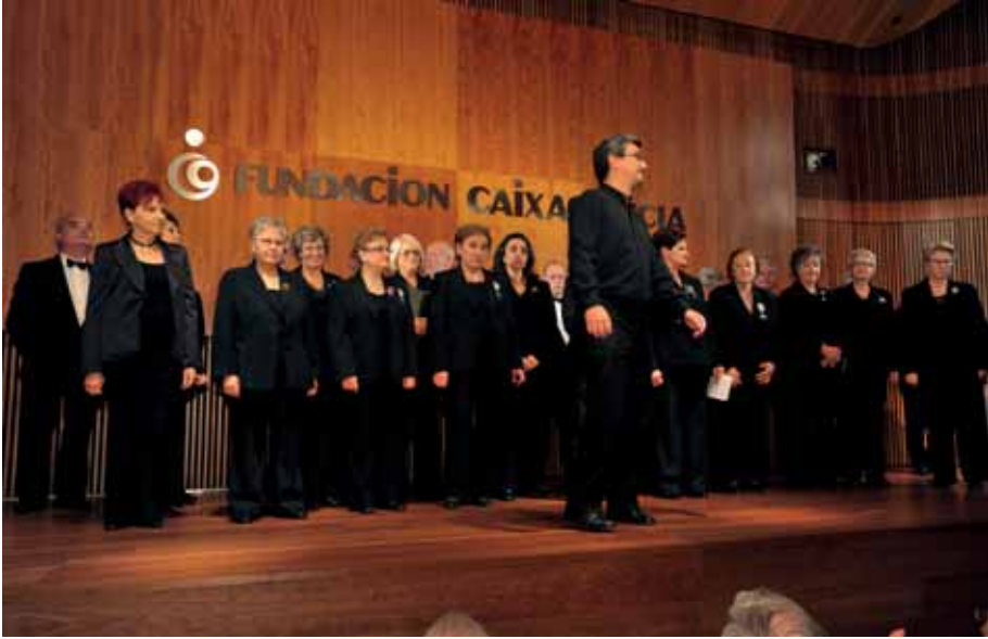
La Coral Polifónica «Follas Novas», de A Coruña.