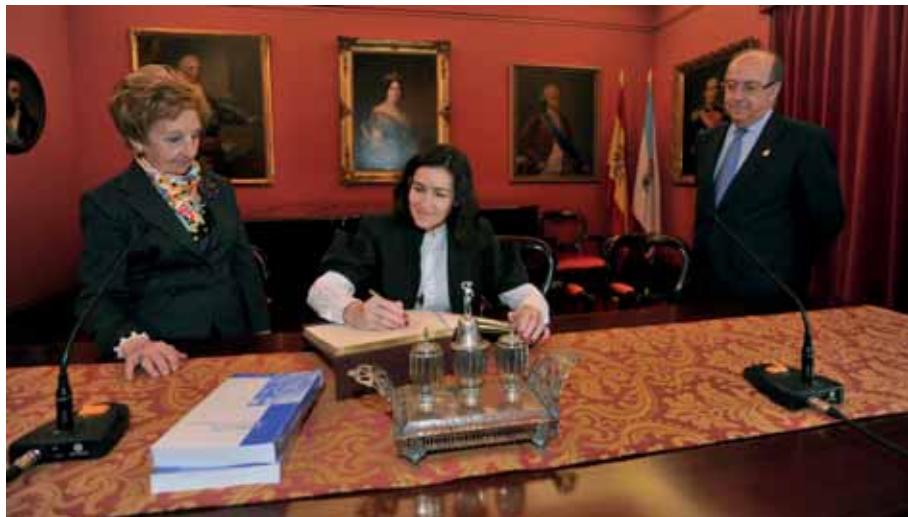
La Ministra de Cultura firmando en el Libro de Honor de la Academia.

ras, Esculturas, Grabados, Cerámicas, Medallas...) que forman su amplia colección, a la vez que se le transmitió la reivindicación de recuperar el segundo piso de la Casa del Consulado (en la que estuvo asentado el Museo Provincial de Bellas Artes) lo cual posibilitaría exponer de manera adecuada todos esos fondos. La ministra firmó en el Libro de Oro de la Academia recordando que en este día hacía un año que había jurado su cargo y agradeció la acogida, a la vez que felicitó a la Institución por la labor desarrollada, prometiendo volver para asistir a la posible inauguración de la Sala de Exposiciones de la Academia en el piso superior del edificio.