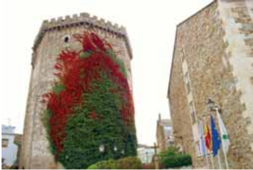
El Torreón de Vilalba, Bien de Interés Cultural y Parador de Turismo.