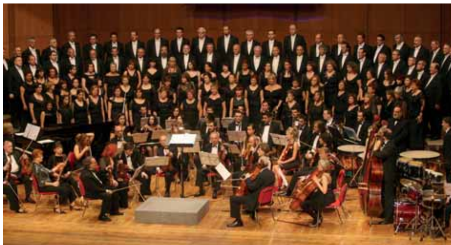
Coral Casablanca de Vigo.