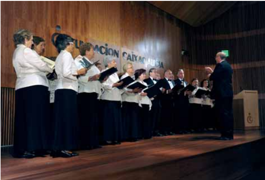
La Coral «Grande Obra de Atrocha», de A Coruña.