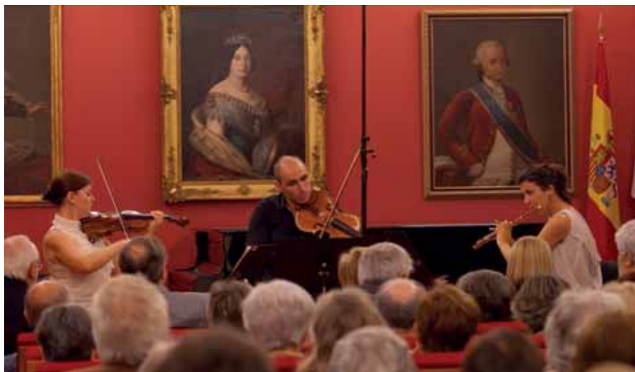
Esemble Ka..