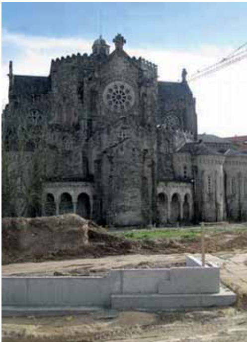
Obras en la Plaza de La Veracruz. O Carballiño.

( Parthenocissus tricuspidata ), cuyas ramas y ventosas se adhieren a los muros, fábricas y mamposterías, con el peligro añadido del efecto de las raíces en la base del monumento. Lo que empezó como una pequeña planta se ha convertido en un pintoresco atractivo, que encierra un daño seguro para el edificio. La planta ha invadido varias caras del perímetro octogonal de la torre, ocultando su arquitectura, con la amenaza de cubrir completamente el BIC. En la sesión del mes de junio se dio cuenta de los escritos remitidos por el Ayuntamiento de Villalba (Lugo) y del Director del Parado Nacional informando de la retirada de la hiedra que cubría el torreón, tal como había solicitado la Academia.