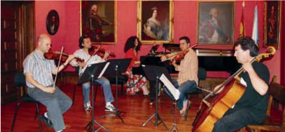
Quinteto «Dezinko».