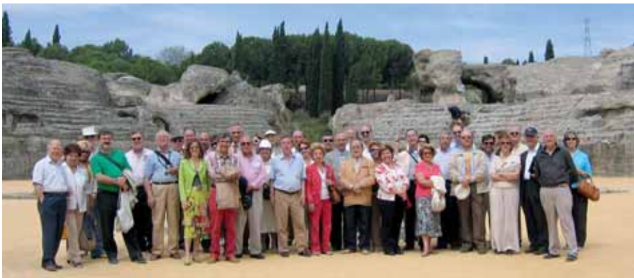
IV Congreso de Reales Academias de Bellas Artes de España, Sevilla, 24 al 27 de mayo de 2006. Visita del anfiteatro romano de Itálica.

Constante reclamación del punto tercero del Título Preliminar de la Ley de Patrimonio Histórico Español, en cuya Ley las Reales Academias son órganos consultivos de la Administración, aspecto que no cumple con los nuevos replanteamientos administrativos ni vincula; necesidad de crear un colectivo o federación que aúne las preocupaciones y actividades de las Academias de Bellas Artes, de cara a su coordinación con problemas europeos y mundiales; velar e insistir entre los efectos de la globalización mercantil y de la deshumanización que lleva a suprimir especialidades y materias en relación con las humanidades y la consiguiente relegación de las Academias; recomendación para seguir con la credibilidad que siempre tuvieron las Academias y que cuanta denuncia e intervención se haga debe ir rigurosamente documentada y justificada, prolongando estas denuncias desde las diferentes administraciones estatales a las autonómicas o municipales, así como a las respectivas fiscalías especializadas en patrimonio e ICOMOS cuando se trate de bienes declarados Patrimonio de la Humanidad, incluso al Defensor del Pueblo.